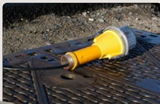
Passer til belysning med 2" rørgjenger.